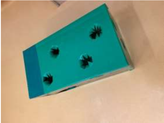
-posoda z luknjo za vtikanje sladolednih palčk.